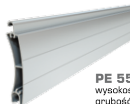
PE 55 wysokość profilu: 55 mm grubość: 14 mm